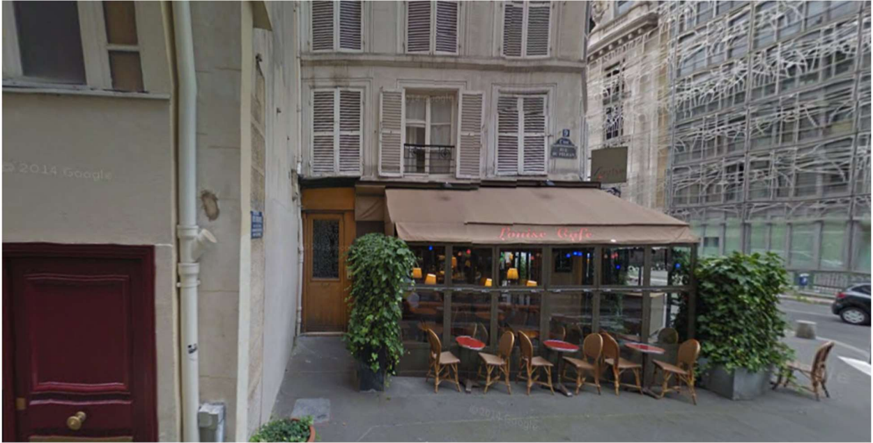
Rue du Pélican, Paris