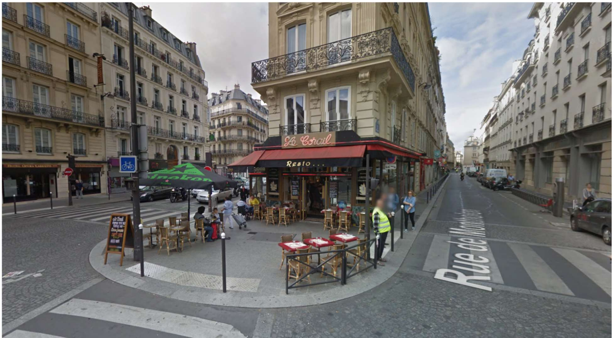
Rue Mayran, Paris